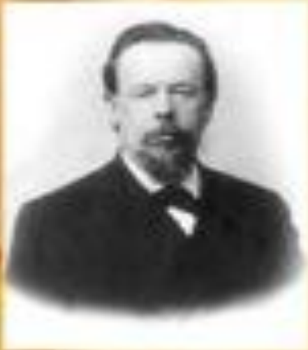
Александр Степанович Попов