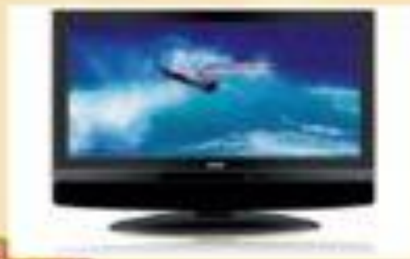
Телевизоры разных лет