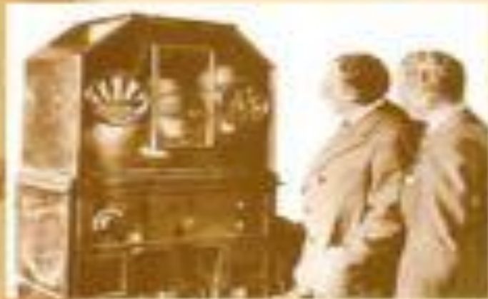
Первая телевизионная трансляция, Би-Би-Си, 1929 г.