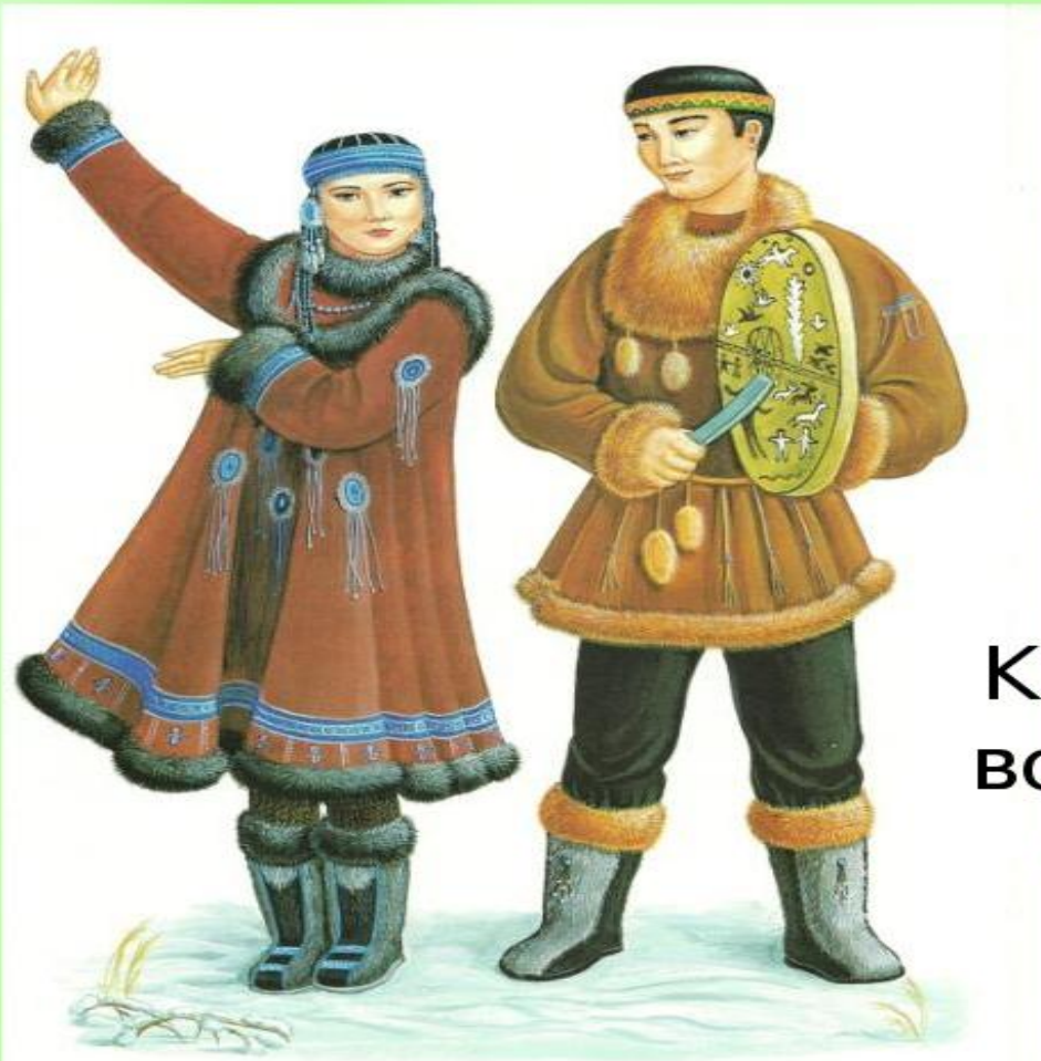
ЧУКОТСКИЙ НАРОДНЫЙ КОСТЮМ