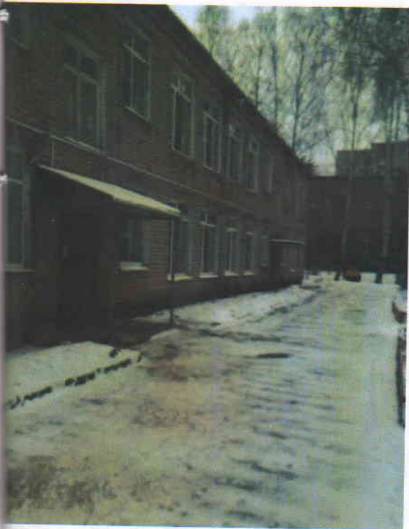
Фото 3 (корпус 1)