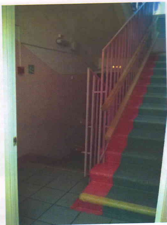
Фото 6 (корпус 2)