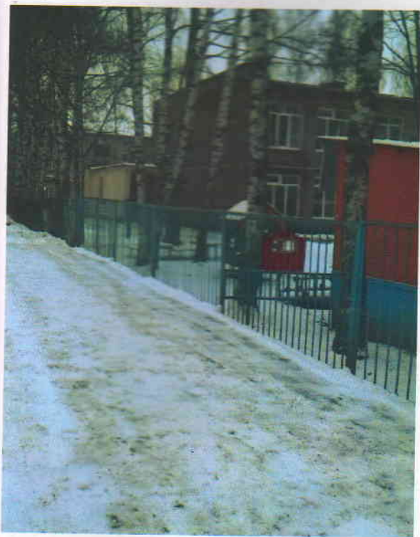
Фото 1 (корпус 1)