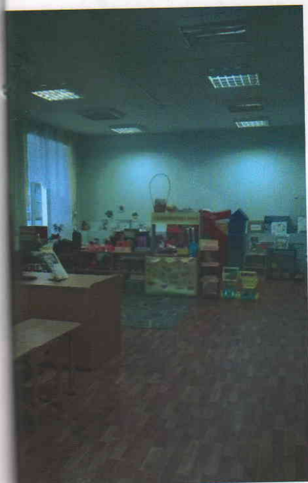
Фото 7 (корпус 2)