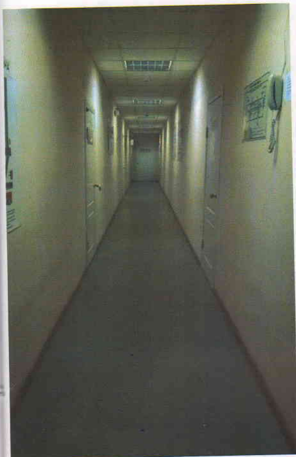
Фото 5 (корпус 2)