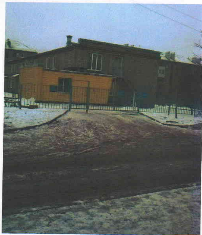
Фото 2 (корпус 2)